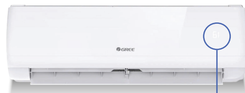
Unité murale VITA