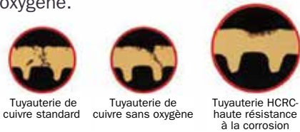
Tuyauterie de cuivre standard Tuyauterie de cuivre sans oxygène Tuyauterie HCRC - haute résistance à la corrosion